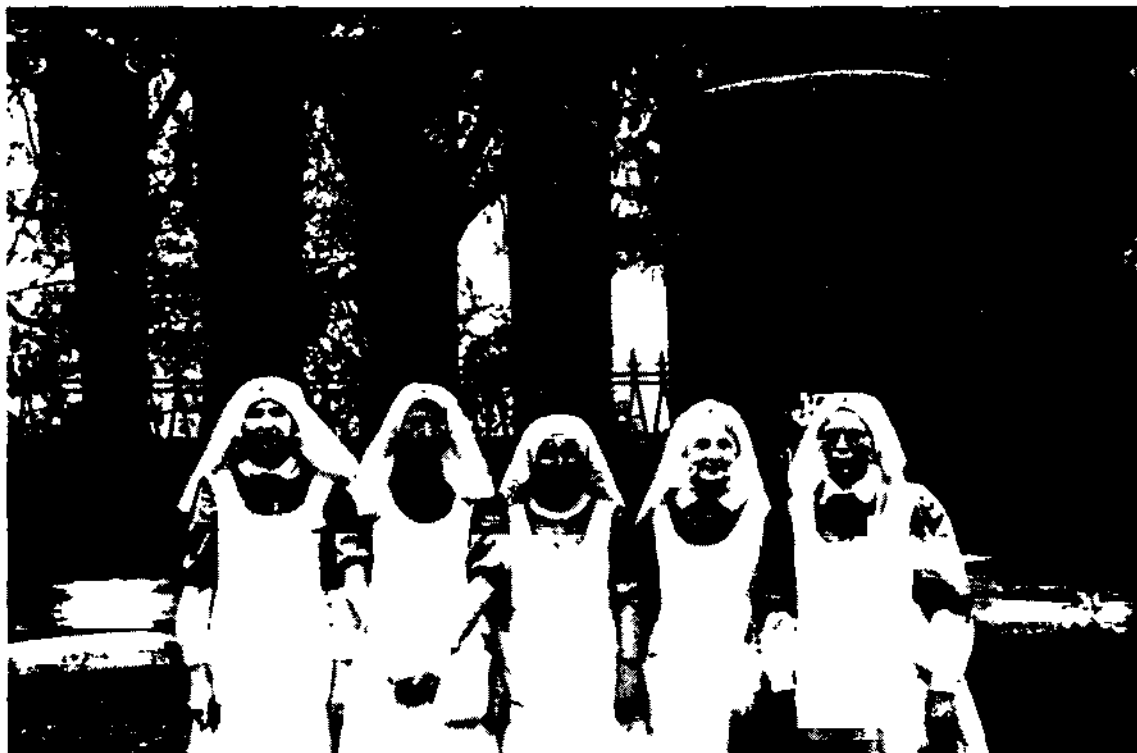
Сестры милосердия у постаumenta памятника П. Г. Ольденбургскому. 1999 г.

«Антиномия» созерцательного и деятельного монашества как двух видов аскетизма такая же древняя, как и само монашество, и отражена в одном из рассказов Лавсаика под названием «О Паисии и Исайи». Два брата, получившие богатое наследство, распорядились им по-разному. Паисии раздал все и преуспел в подвижничестве и молитве. Исайя же устроил себе монастырь, прославленный своей благотворительностью, на деньги, полученные в наследство. По смерти братьев монахи заспорили, чье житие совершеннее. Прп. Памва рассудил, что оба брата равно совершенны и в откровении от Бога «видел их обоих стоящими вместе перед Богом в раю». 1