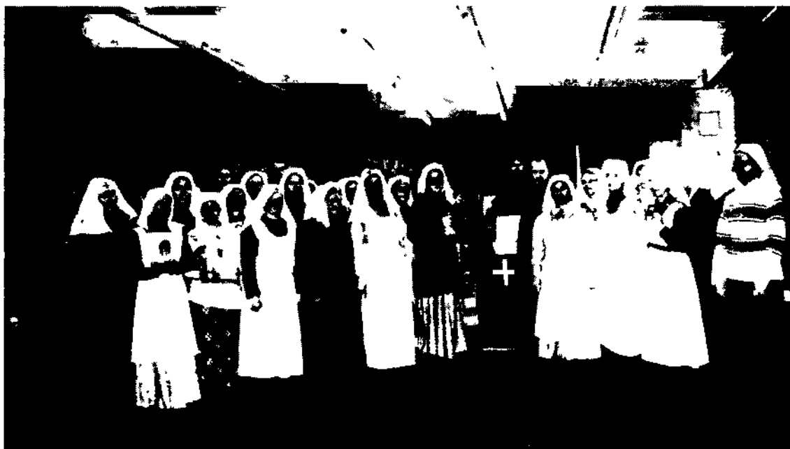
Сестры Покровской общины у мощей свв. прмци. Великой княгини Елисаветы и инокини Варвары в Мариинской больнице. 15 февраля 2005 г.

В ответ на вопрошание архиерея сестры дают обет «вольного служения Богу в ближних», а также обещаются «нерушимо хранить святую веру Христову, уставы святых Церкви православных, целомудрие, нестяжание и послушание настоятельнице». К основному обету здесь, как мы видим, добавляется три монашеских. Обет именуется архиереем священным. Для Елисаветы Феодоровны и некоторых сестер он был пожизненным, но мог приниматься и на какое-то определенное количество лет. Весь чин требует подробного рассмотрения, здесь же отметим, что весь он пронизан одной идеей — посвящением сестер для церковного служения (диаконии) Богу в ближних. Если признается каноничность этого чина и действенность обетов, то, по сути, св. Елисавета являлась и церковной служительницей (диакониссой).