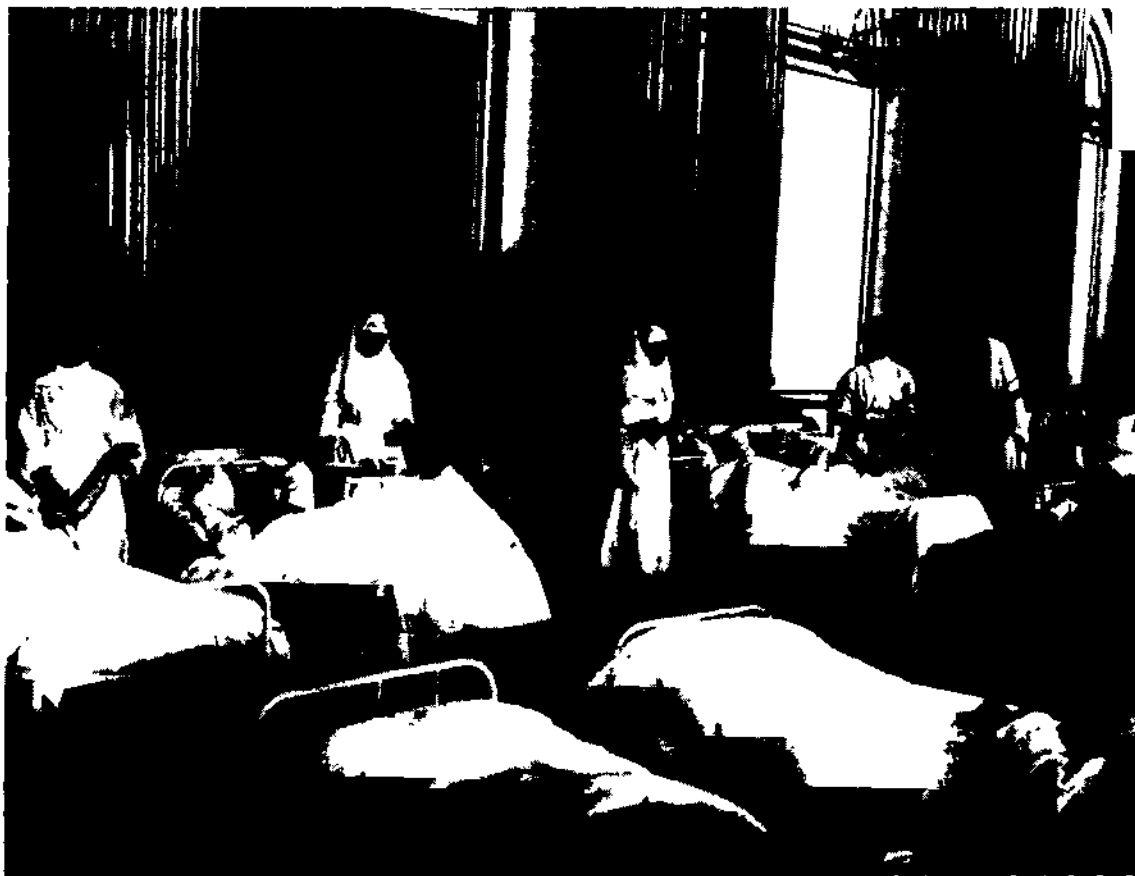
Сестры милосердия за работой в лазарете им. Царевича Алексея Николаевича, устроенном на 1000 мест в залах Зимнего дворца. 1914 г.