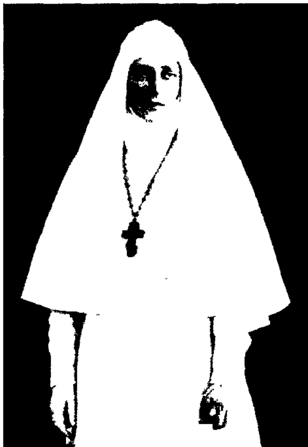
Св. прпмц. Великая княгиня Елисавета Феодоровна в облачении настоятельницы Марфо-Мариинской обители милосердия