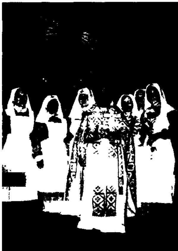
Покровская община. После посвящения в сестры с настоятелем Князь-Владимирского собора о. Владимиром Сорокиным. 14 октября 2002 г.

Великой княгине не удалось добиться окончательного присвоения сестрам Марфо-Мариинской обители звания диаконисе. Этот вопрос, представленный Московским митрополитом Владимиром, рассматривался на заседаниях Святейшего Синода дважды: 9 ноября и 9 декабря 1911 г. Следует заметить, что сама обитель была уже ранее утверждена Святейшим Синодом как церковное епархиальное учреждение при митрополите Московском. Большинство — 7 из 9 — архиереев, присутствующих в Синоде, постановили «усвоить искомое звание» сестрам обители. Среди них: митрополит Московский Владимир (Богоявленский), архиепископ Финляндский Сергей (Страгородский), архиепископ Волынский Антоний (Храповицкий), епископ Холмский Евлогий (Георгиевский). «За» высказался также обер-прокурор В. К. Саблер. При особом мнении оказался митрополит Санкт-Петербургский Антоний (Вадковский): «Пока не восстановлен чин диаконисе