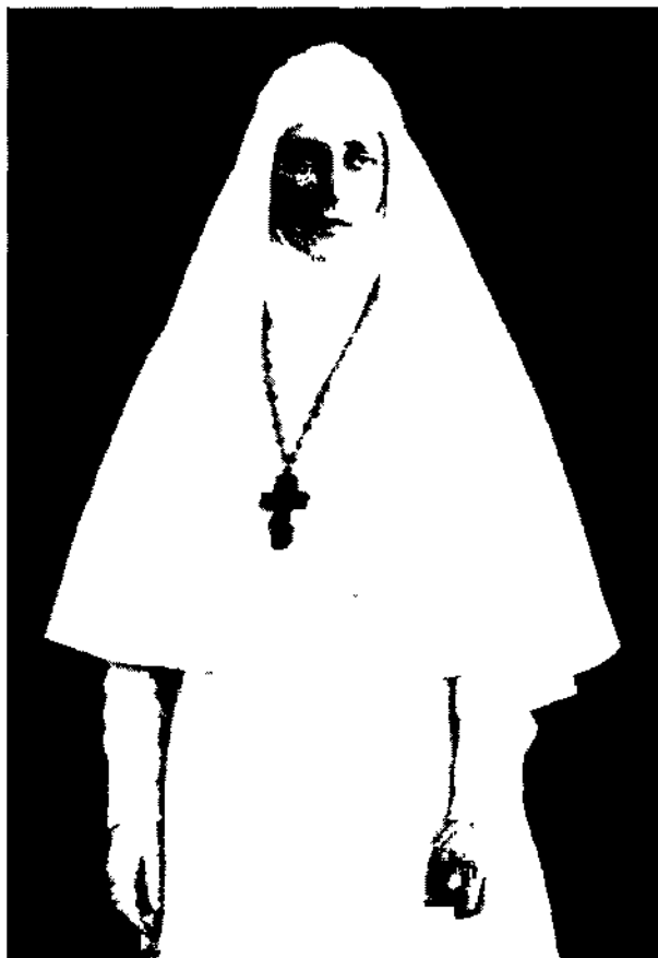
Св. прпмц. Великая княгиня Елисавета Феодоровна в облачении настоятельницы Марфо-Мариинской обители милосердия

Возможно, это был образ Спаса Нерукотворного, которым Император Александр III благословил свою невестку при переходе ее в православие. На теле новомученицы был найден и кипарисовый настоятельский крест на такой же деревянной цепочке, 4 возложенный на нее митрополитом Московским Владимиром при посвящении в настоятельницы Марфо-Мариинской обители. Этот крест остался где-то в России. О парамане же и параманном кресте никто не упоминает. Вряд ли он был сорван палачами, так как известно, что с алапаевскими узниками обращались гуманно и им даже разрешали ходить без охраны в церковь. Все тела убиенных были в одежде. В карманах у них остались документы и личные вещи. 5 Никаких следов грабежа и издевательств перед казнью не отмечено.