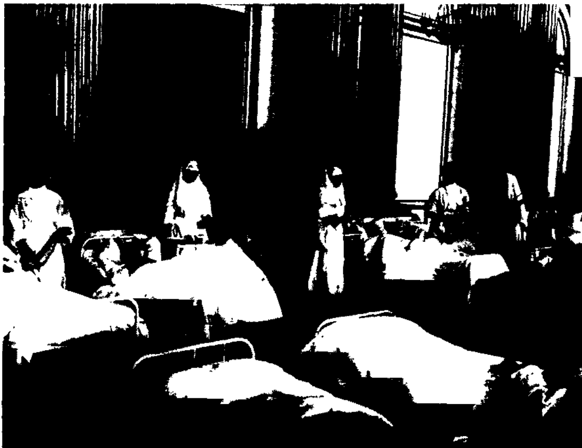
Сестры милосердия за работой в лазарете им. Царевича Алексея Николаевича, устроенном на 1000 мест в залах Зимнего дворца. 1914 г.